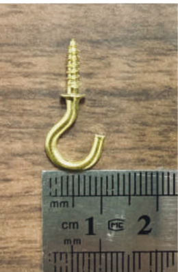
▲フックのサイズ感